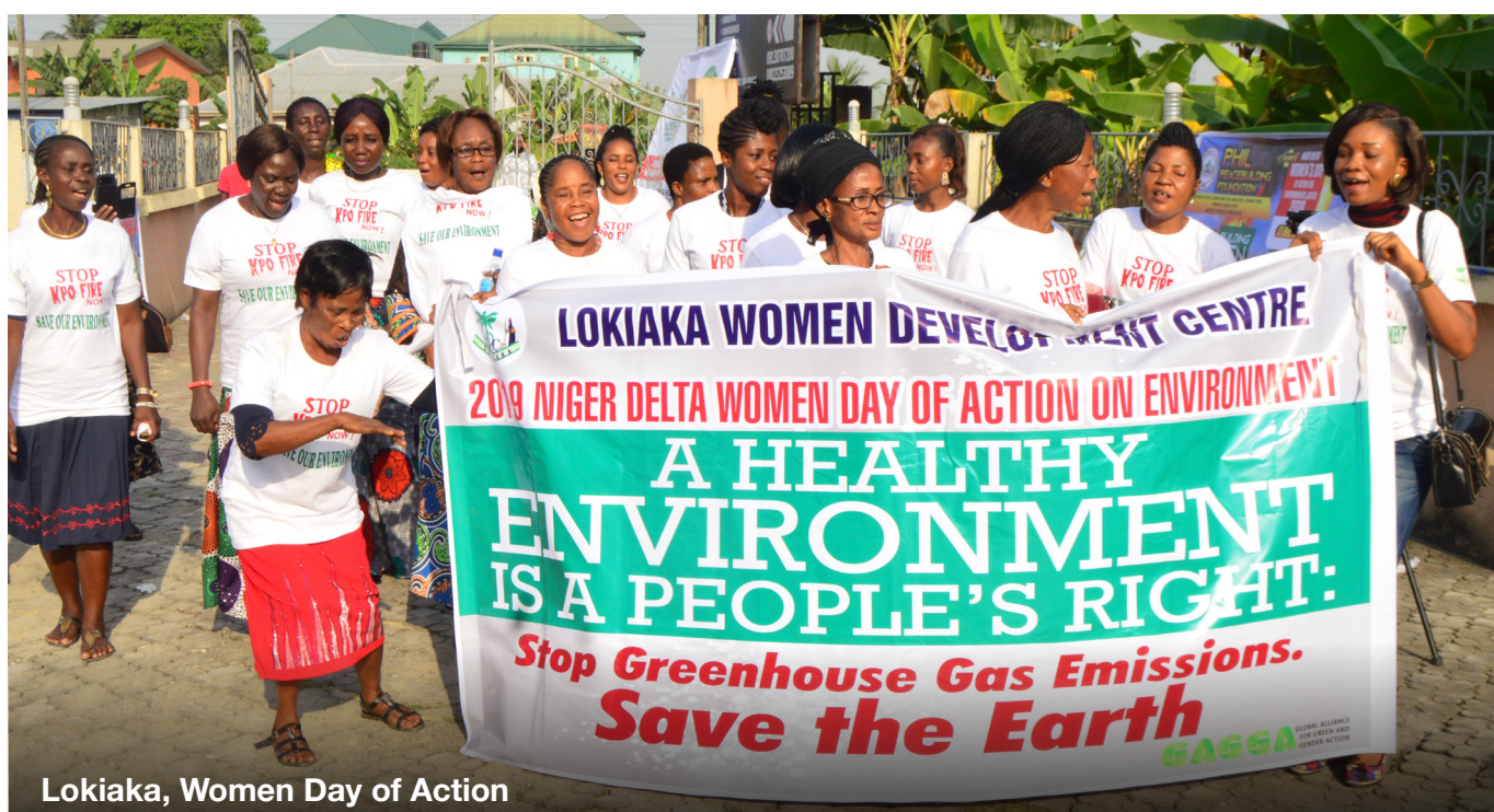
Lokiaka, Women Day of Action

Vrouwenfondsen spelen daarnaast een grote rol in het beperken van de risico's waar donateurs vaak voor waarschuwen. Ook zijn ze onmisbaar voor een diepgaander inzicht in die risico's en hebben ze de ervaring en de middelen om te voldoen aan de risicovoorschriften van donateurs. Met een portefeuillebenadering ontvangen verschillende organisaties gezamenlijk geld. Zo kunnen feministische fondsen niet alleen het geld, maar ook de risico's over de hele portefeuille verdelen, en daarmee het vertrouwen van hun partners waarmaken. Omdat vrouwenfondsen zelf onderdeel zijn van de bewegingen die zij financieren, hebben ze de juiste methoden, netwerken en kennis van de lokale context. Zo kunnen ze activisten beschermen en beter inspelen op de behoeften van hun partners. Ten slotte kunnen vrouwenfondsen een groot bedrag over talloze kleinere organisaties verdelen, waardoor ze een veel grotere impact hebben. Ze kennen de voordelen van het ondersteunen van allerlei verschillende feministische bewegingen om gender-, sociale, raciale en klimaatrechtvaardigheid te bereiken. Hun werk is nog niet klaar en de strategieën en impact van deze feministische organisaties moeten beter worden gedocumenteerd. Met voldoende inkomsten kunnen vrouwenfondsen hun potentie nog beter waarmaken: door de impact te laten zien van de bewegingen en organisaties die ze steunen en te delen wat ze geleerd hebben en welke strategieën hebben bijgedragen aan het succes.