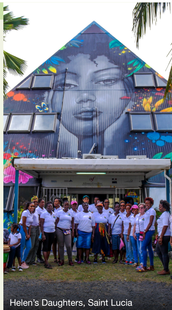
Helen's Daughters, Saint Lucia

Door gendernormen wordt de rol van vrouwen in de agrarische waardeketen in Saint Lucia vaak onderschat en ondergewaardeerd. Als reactie daarop stimuleert Helen's Daughters toekomstige en bestaande boerinnen om duurzaam en klimaatvriendelijk te gaan boeren. Deze vrouwenrechtenorganisatie kiest hierbij een meervoudige benadering, waarin ze rekening houdt met de complexe dynamiek van gender, klimaatrechtvaardigheid en landbouw. De holistische programma's omvatten drie pijlers: onderwijs (trainingen, beurzen, stages), ondersteuning van boerinnen (subsidies, toegang tot de markt) en programma's voor gezondheid en welzijn (gezondheidsklinieken op het platteland, zorgverzekering). Een van de meest ingrijpende effecten van het werk van Helen's Daughters is dat deze organisatie opnieuw definieert wat het betekent om vrouw te zijn in een agrarische samenleving. Dit begint bij het beeld dat boerinnen daar zelf van hebben. Dat heeft geleid tot een grote transformatie: vrouwen die zich eerst onzichtbaar voelden, zijn gaan beseffen hoe belangrijk hun rol is voor de voedselzekerheid in Saint Lucia.