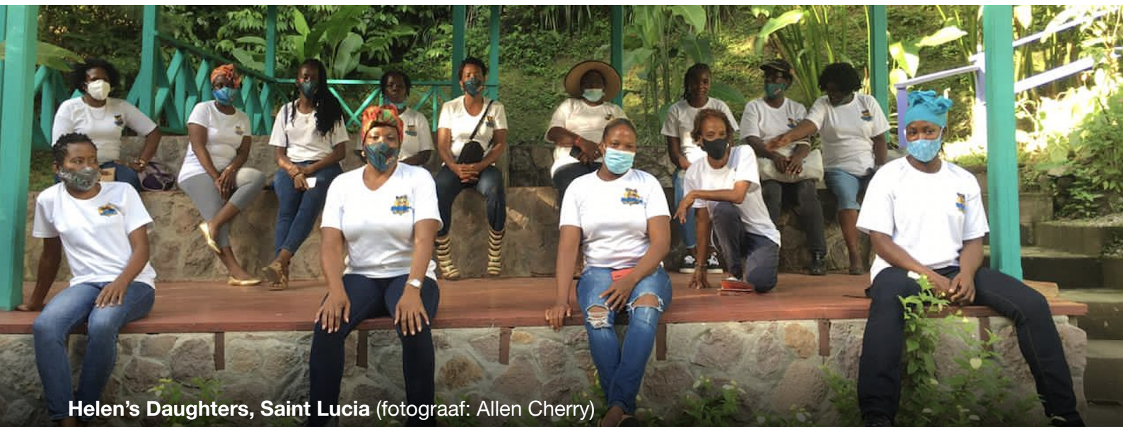
Helen's Daughters, Saint Lucia

Veel van hun werk is goed gedocumenteerd in de literatuur over gendergelijkwaardige klimaatoplossingen. Deze term beschrijft een bottom-up en mensgerichte aanpak die gebaseerd is op gelijke rechten. Klimaatactie draait daarbij om gendergelijkheid en democratie, want via die weg moeten de onderliggende oorzaken van klimaatonrecht worden aangepakt. In de Feminist Agenda for People and Planet van WEDO wordt uitgelegd dat de klimaatcrisis voortkomt uit ideologieën die ongebreidelde groei als doel hebben. Op een eindige planeet is die groei alleen haalbaar via grondstofwinning, uitbuiting en verwoesting. 2 Door bestaande machtsstructuren aan de kaak te stellen en de achterliggende oorzaken van de klimaatcrisis aan te pakken, gaan de feministische bewegingen in tegen de heersende ideeën over wat klimaatactie zou moeten inhouden. Daarmee dragen ze bij aan bredere veranderingen in de werking van onze economieën en samenlevingen. Hierbij maken deze bewegingen de essentiële keuze voor een intersectionele benadering door inclusieve, op vertrouwen gebaseerde en weerbare netwerken op te bouwen. Daarin draait alles om de kennis en het perspectief van diverse, vanuit gemeenschappen geleide en structureel uitgesloten groepen.