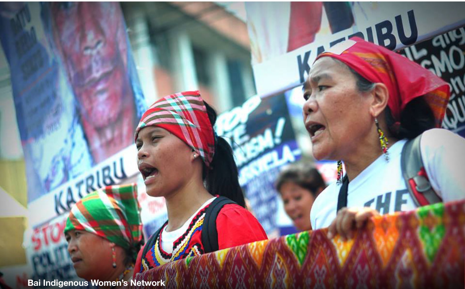
Bai Indigenous Women's Network

WEDO: Women's Environment Development Organization