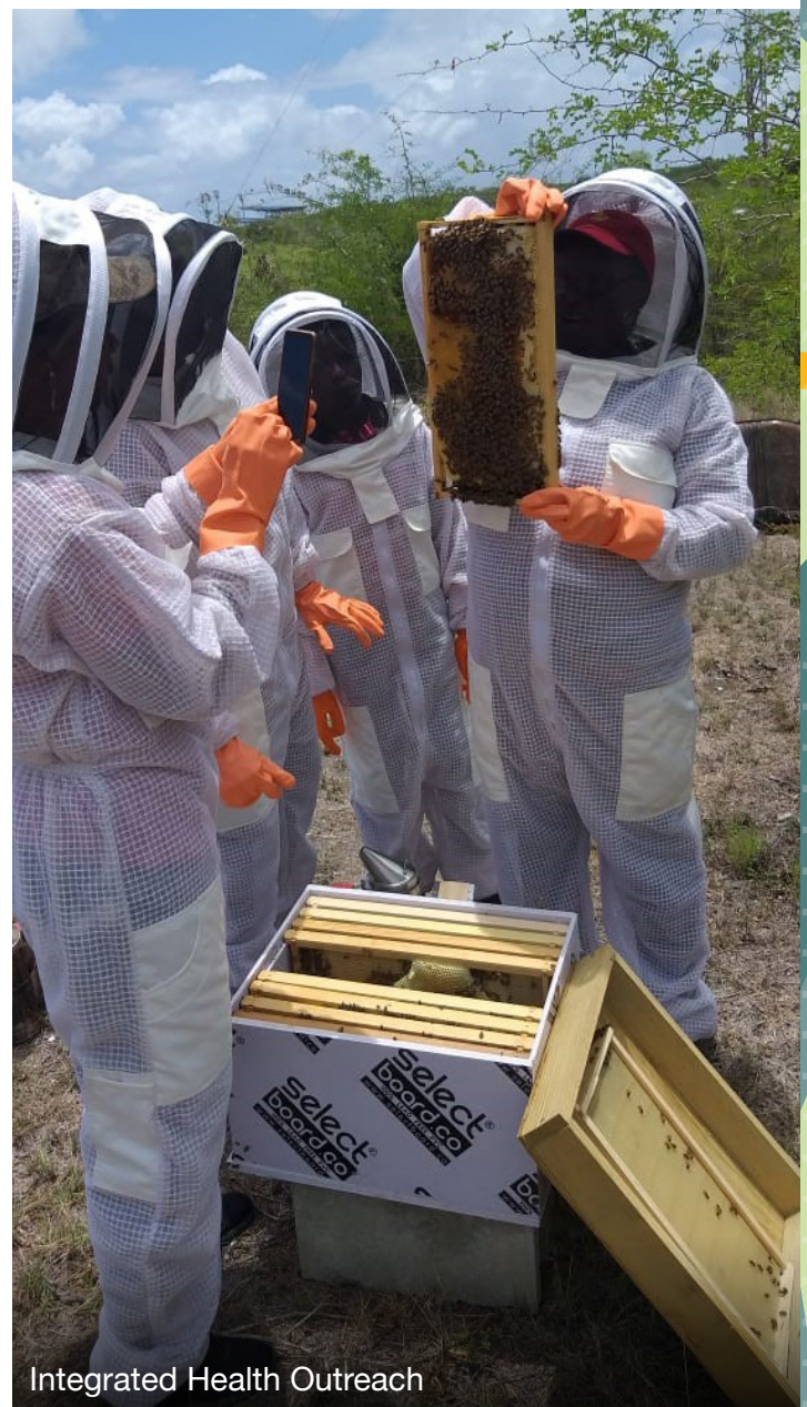
Integrated Health Outreach

Als je organisaties in de frontlinie niet financiert, levert dat een groter risico op dan vasthouden aan de huidige risicokaders. Een beperkte definitie van risico negeert namelijk twee urgente en reële risico's: ten eerste dat de oneerlijke status quo die juist verantwoordelijk is voor de klimaatcrisis, wordt versterkt, terwijl activisten juist steun nodig hebben om hiertegen te strijden. Ten tweede nemen feministische activisten grote persoonlijke risico's, vooral Inheemse vrouwen en vrouwen die zich inzetten voor milieuen vrouwenrechten. Ze krijgen vaak te maken met ernstige represailles en bedreiging van hun gezondheid en veiligheid. Sinds 2012 zijn er 1910 activisten op het gebied van landbezit en milieu vermoord, waarvan 34% afkomstig uit Inheemse gemeenschappen. 40 Ondanks deze risico's blijven ze als leiders en bouwers van hun beweging vastberaden hun werk doen en hun kritische blik op klimaatrechtvaardigheid inzetten op alle niveaus: lokaal, regionaal, nationaal en internationaal. Donateurs hebben de verantwoordelijkheid om de moed van deze activisten mee te nemen in nieuwe vormen van financiering gericht op mogelijkheden en kansen.