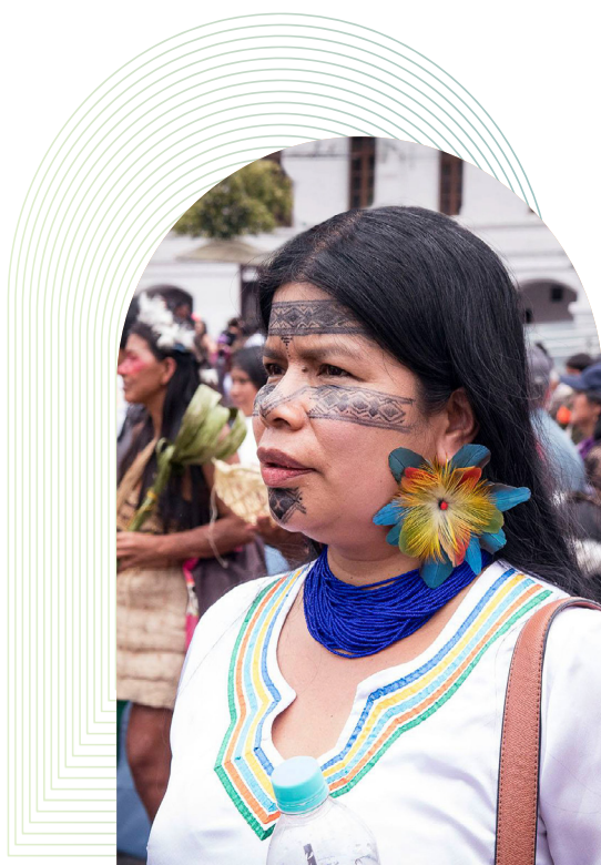
Mujeres Amazónicas Defensoras de la Selva

Feministische bewegingen en organisaties spelen een cruciale rol in de bevordering van klimaatrechtvaardigheid en het behalen van meerdere ontwikkelingsdoelen. 18 Desondanks ontvingen vrouwenrechtenorganisaties volgens de OESO in 2020-2021 slechts 547 miljoen dollar. Dat is ongeveer 1% van het totale bedrag aan ontwikkelingshulp dat bestemd was voor gendergelijkheid en empowerment van vrouwen. 19 De literatuur over de samenhang tussen gendergelijkheid en het milieu wijst op de noodzaak om feministische bewegingen en organisaties, waaronder lokale maatschappelijke organisaties en Inheemse en lokale gemeenschappen, 20 te ondersteunen en te betrekken. Toch ging in 2018-2019 nog altijd maar 0,22% van de klimaatgerelateerde ontwikkelingshulp naar vrouwenrechtenorganisaties. 21 En van het totale geschatte bedrag aan filantropische donaties voor klimaatgerelateerde doelen, ging slechts 3% direct naar organisaties van vrouwelijke milieuactivisten. 22