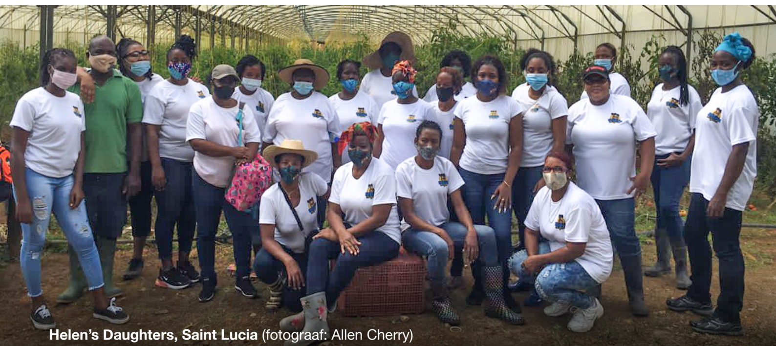
Helen's Daughters, Saint Lucia

Bovendien loopt het grootste deel van de klimaatfinanciering (57%) via leningen in plaats van subsidies, wat de regionale ongelijkheid en koloniale erfenis juist versterkt. Het zorgt er namelijk voor dat de schuldenlast van landen die al onevenredig worden geraakt door klimaatverandering alleen maar toeneemt. 12 De toegang tot klimaatfinanciering verloopt vaak traag, is complex, kostbaar, projectgebonden en over het algemeen weinig transparant. Ook zijn er weinig mogelijkheden op basis van subsidies. 13 Een recent OESO-rapport toont aan dat deze belemmeringen en structurele ongelijkheid het lokale maatschappelijke organisaties zo goed als onmogelijk maken om de benodigde middelen te bemachtigen om hun werk te kunnen doen, omdat maar een fractie van het geld lokaal terechtkomt en dan ook nog onregelmatig. 14